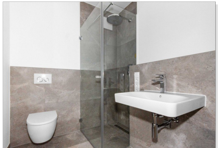
Main Estate - Mehrfamilienhaus Berger Straße Frankfurt am Main - 326 - 1-05 - 1