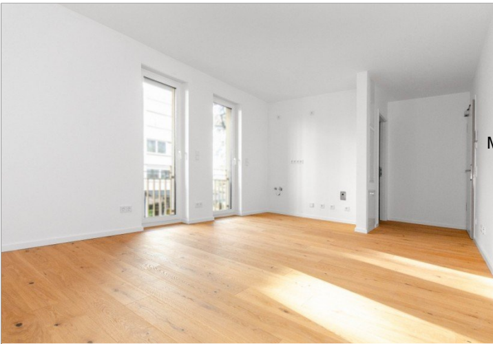
Main Estate - Mehrfamilienhaus Berger Straße Frankfurt am Main - 326 - 1-05 - 2