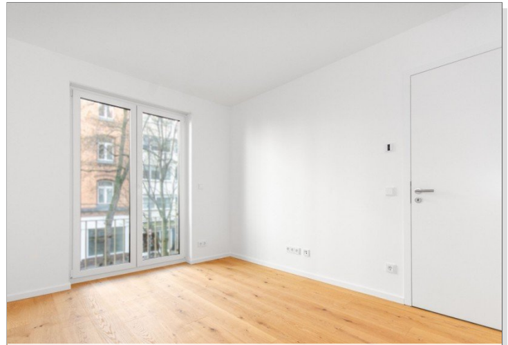
Main Estate - Mehrfamilienhaus Berger Straße Frankfurt am Main - 326 - 1-05 - 3